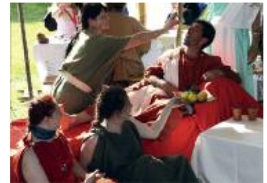
Römische Rüst- und Kleiderkammern, Foto-Studio, Schwertpfahl, Getreidemühle, Spieltische